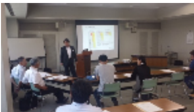
ワークショップ風景(イメージ)