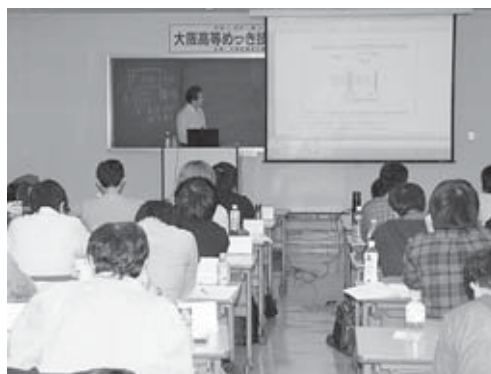
週一回の研修風景